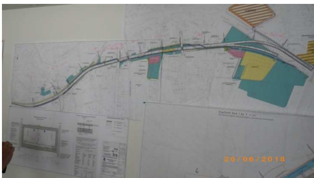
Lageplan des Hafentunnels