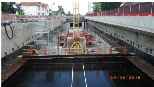
Baustellenfotos des Hafentunnels