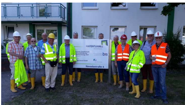
IVC – Teilnehmer an der Baustellenbesichtigung